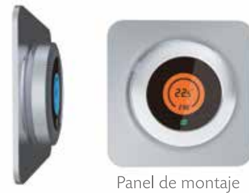
Panel de montaje